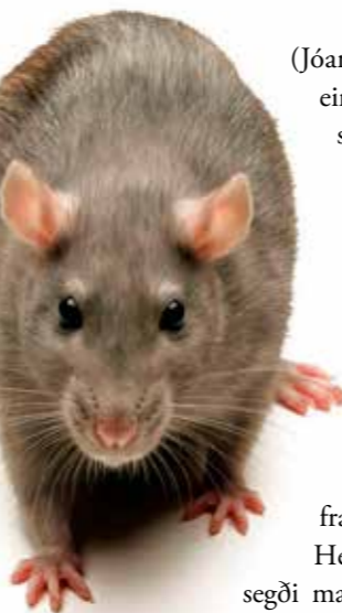
„Her komi eg við langari nos, hvat skal eg hava í mínari pøs“

(Jóannes Rasmussen) og ein maður úr Kirkjubø, skipaðu fyrri. Menn samlaðust í einum neysti í bygdini at baka breyð, har rottugift varð koyrd í breyðið. Næsta dag fóru menn um alla oydna at leggja hesi breyðini út,“ greiðir hesin maðurin frá.