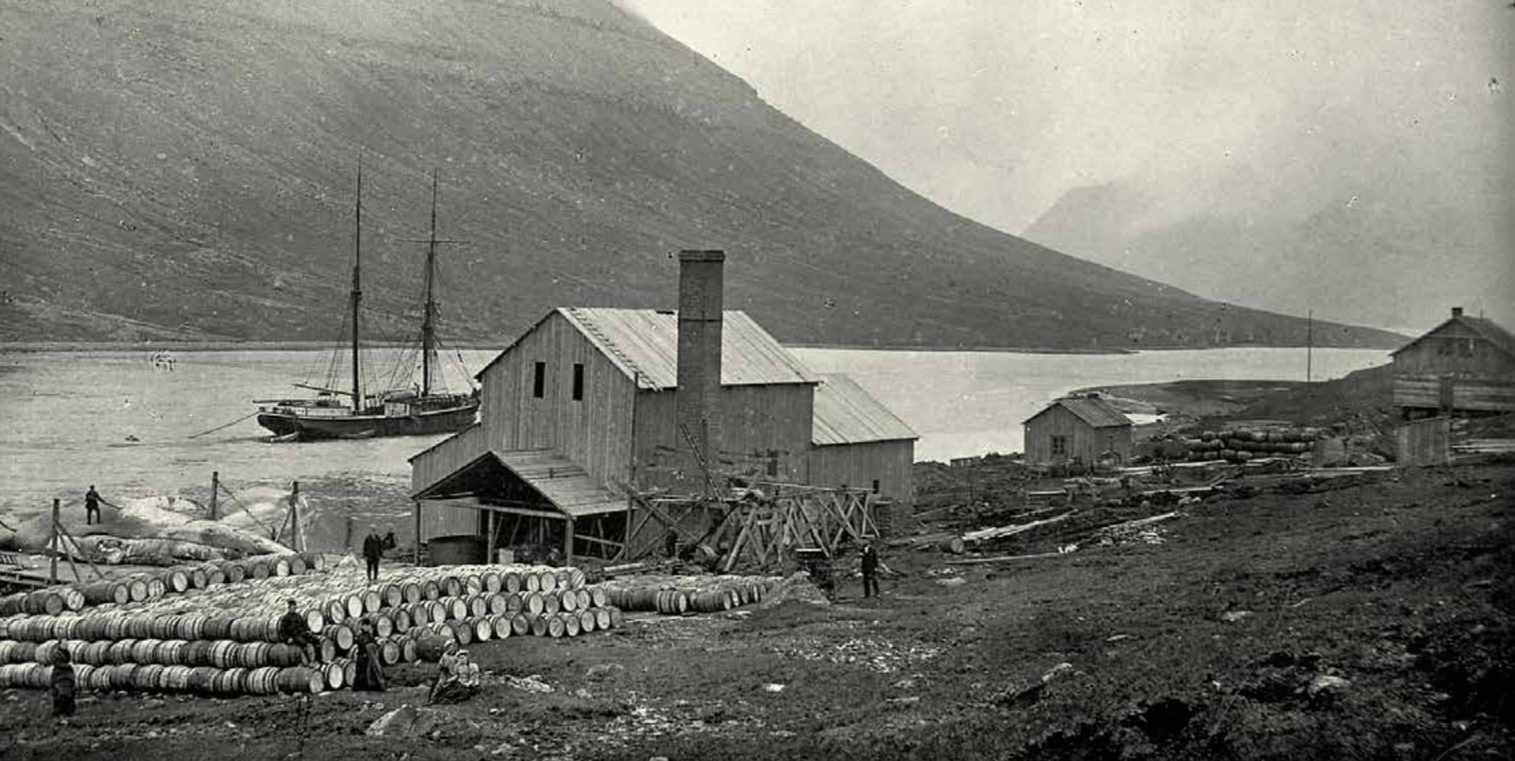
Mynd 3. Hvalastøðin við Kópagarðar norðan fyrri bygdina Norðdepil, har norðmenn høvdu hvalastøð um aldar-skiftið. Frá hesi hvalastøðini spjaddu rottur seg runt á Borðoyggi og Viðoyggi. Seinni kom hon eisini til Kunoy.

Mynd 4. 8. november 1952 hevur Norðlýsið forvitnisliga grein, har greitt verður frá átakinum at týna rottuna í Kunoy.