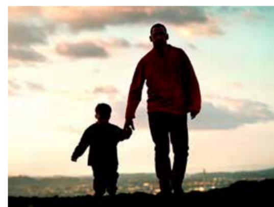
Ein útav tíggju, ið fáa prostatakrabba, fáa krabba orsakað av ættarbrögdi

Fert tú ofta á vesi bæði um dagin og um náttina, hevur tú eina veika urinstrálu og føilir tó ofta, at tú bráðliga hevur trongd til at lata vatnið? So skalt tú vera uppmærksamur