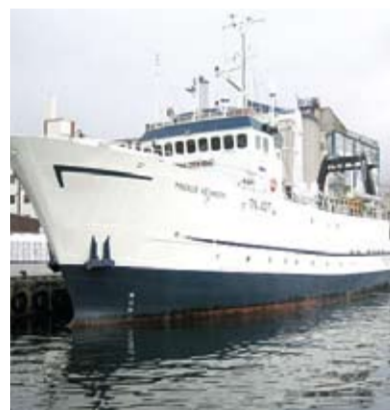
Rannsóknarskipið Magnus Heinason við bryggju. Stórar partur av dátugrundarlagnum undir nýggju botnkortunum er innsavnaður við hesum skipinum.

Botndátur frá ymsum keldum hava í nøkur ár verið nýttar til at framleiða botnkortini, sum eru ein grunnleggjandi partur av arbeiðinum á Náttúruvísindadeildini á Fróðskaparsetrinum við at teldusimulera sjóvarfalsrákið og alduviðurskiftini á landgrunninum. Hesi kortini geva áhugaverda og nýggja vitan um havbotnin kring oyggjarnar, sum í nøkrum forom víkja frá skúalærdominum, men sum eisini kunnu verða við til at lúka altjóða ásetingar um navngvevan á havbotninum.