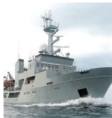
Vaktar og bjargingskipið Tjaldrið. Dýpdarmátningar eftir slóðini hjá Tjaldinum í ár 2000 er partur av grundarlagnum undir nýggju botnkortunum.

stimbra til at brúka neyvri og eintýðug staðarnavn. Seinastu árin er áheitanin víðkað til eisini at umfata havbotnin, serliga nú ið nútímans tækni ger tað møgult at kortleggja havbotnin eins væl og lendi á landi. Nýggju kortini gera tað møgult at vera við til at fylgja komandi altjóða ásetingum og samstundis varðveita og brúka ein part av gomlu útróðrarmentanini.